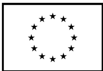
Kaasrahastanud Euroopa Liit

Projekti toetab Euroopa Küberkompetentsikeskus oma liikmetega.