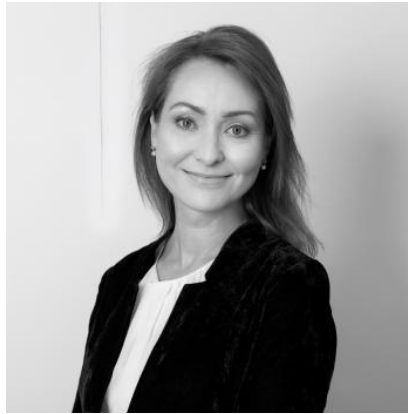
LIS RAIEND JURIST